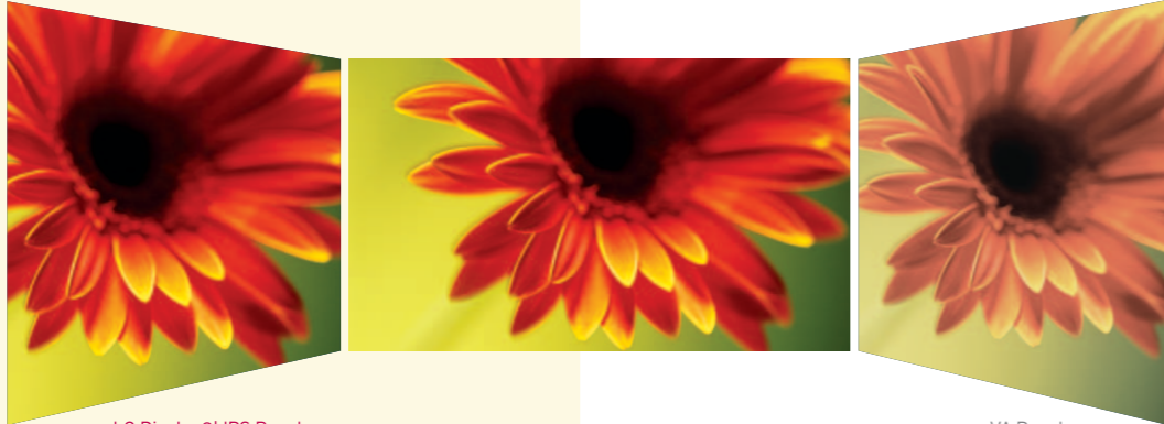
LG Display의 IPS Panel