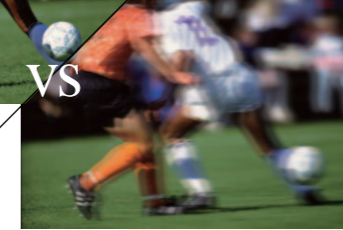
VA Panel VA 패널 9~10ms수준

과거 초창기에 출시된 LCD TV로 축구 중계방송을 보신 적이 있으신가요? 축구선수가 골대를 향해 빠른 속도로 질주하고 있습니다. 그런데 방금 전 선수가 출발한 장소에서부터 골대 앞까지 선수가 달려간 흔적이 보입니다.