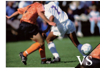
LG Display의 IPS Panel 동영상 응답속도 (MPRT) 8ms 수준